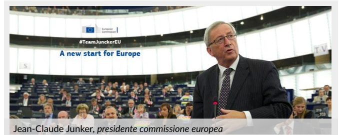
Jean-Claude Juncker, presidente commissione europea